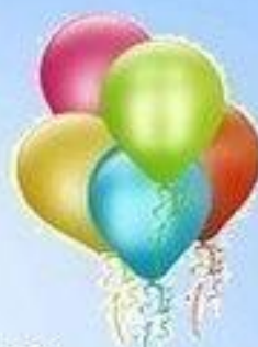
Пять воздушных шаров